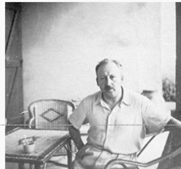
Portrait de René Laforgue