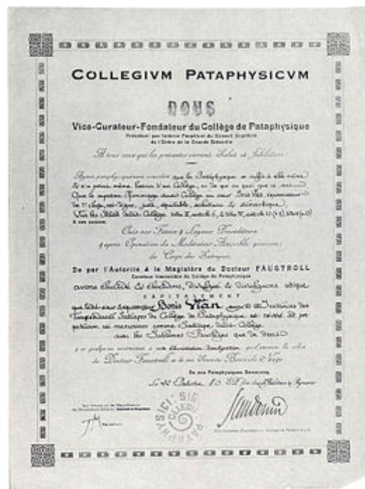
Diplôme de Satrape du Collège de 'Pataphysique, décerné à Boris Vian, le 22 Palotin 80 (11 mai 1953).

Diplôme du collège de 'Pataphysique de Boris Vian , le 22 Palotin 80 (11 mai 1953).