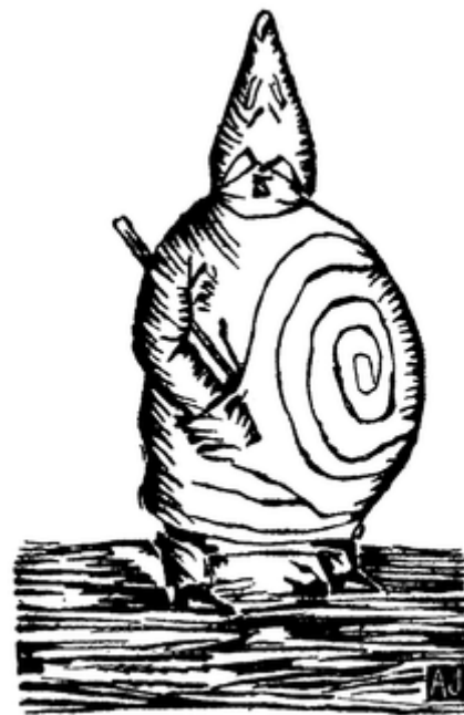
Véritable Portrait de Monsieur Ubu . Dessin d' Alfred Jarry .

Le Collège a essaimé en de nombreux instituts étrangers (argentin, milanais, limbourgeois, germain, suédois, londonien, hispanique, napolitain, batave, chinois, québécois, américain...).