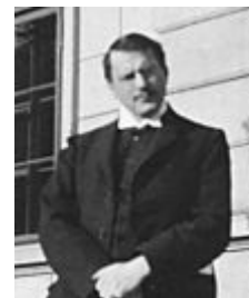
Carl Gustav Jung