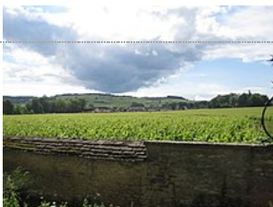
Château de Pommard et clos château de Pommard.

Depuis la Libération, il est actif dans le mouvement d'extrême-gauche antistalinien. Il est l'un des fondateurs, avec Cornelius Castoriadis et Claude Lefort, du groupe et de la revue Socialisme ou barbarie (1948).