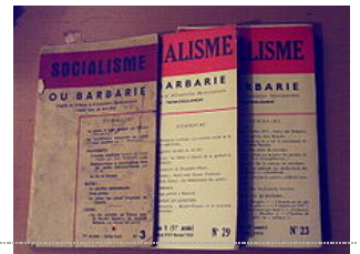
Numéros de la revue Socialisme ou barbarie .