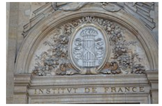
Frontispice de l'Institut de France.