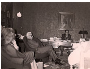
Équipe éditoriale des OCFP , chez Jean Laplanche.

Laplanche dirige aux Puf, la « Bibliothèque de psychanalyse » (1973), la collection « Voix nouvelles en psychanalyse » (1979) qui rassemble des premiers travaux de chercheurs d'origine universitaire, et la revue Psychanalyse à l'université (1975-1994).