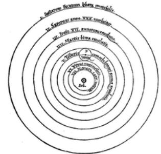
De revolutionibus de Copernic, la première blessure narcissique de l'humanité selon Freud.