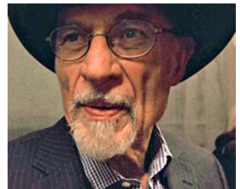
Irvin Yalom en septembre 2014