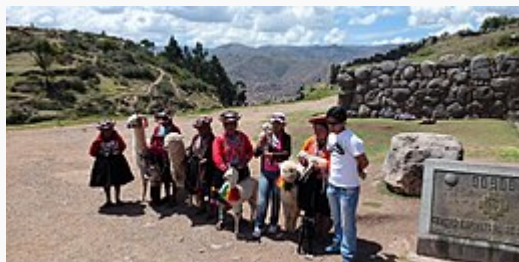
Site Inca de Kenko Cuzco.