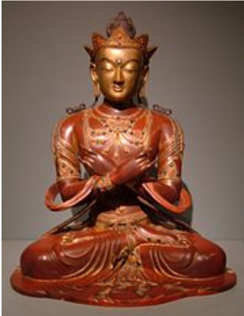
Sculpture du Bouddha Vajradhara

Le vajrayāna reprend les concepts du mahāyāna. En outre, le corps absolu y est parfois nommé adibuddhā (tib. thogma sangya) ou « bouddha auto-créé » et peut constituer un quatrième corps sahajakāya transcendant, primordial, inchangé et indestructible, sans forme et sans action, bien qu'il puisse donner lieu à des émanations visibles. Il est nommé Vairocana dans le bouddhisme Shingon, Samantabhadra dans la plus ancienne école tibétaine (Nyingmapa) et Vajrasattva ou Vajradhara dans les courants ultérieurs comme Kagyupa ou Gelugpa.