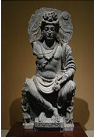
Maitreya, le bouddha du futur, avec la fiole contenant le nectar du dharma dans la main gauche ; art du Gandhara, II e siècle.

Le bouddhisme ancien ou le bouddhisme theravāda considère que seuls de rares individus emprunteront la voie du bodhisattva, dont l'aboutissement est l'éveil pur et parfait du samyaksambouddha , qui permet de « faire tourner la roue du dharma » et de répandre la bonne doctrine dans le monde. Ils en ont fait le vœu de nombreuses existences auparavant devant un bouddha du passé. Les détails de la carrière de bodhisattva ont pu varier d'école à école. Le Buddhavamsa décrit un processus comprenant trois grands kalpas avant d'accéder à l'existence où le bodhisattva deviendra bouddha. Ayant atteint le nirvāna, le bouddha (comme l'arhat) vit sa dernière existence ; la mort signale l'extinction totale (parinirvana).