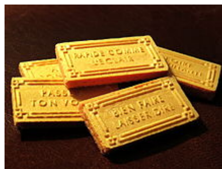
Gaufrettes à messages

Certaines gaufrettes portent des messages qui peuvent être interprétées comme des sentences s'appliquant à leur lecteur. C'est aussi parfois le cas sur des emballages de bonbons ou de morceaux de sucre.