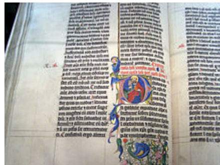
Bible ancienne ouverte

On qualifie souvent de bibliomancie des techniques proches, telles que les sortes homericæ (sorts homériques) et les sortes virgilianæ (sorts Virgiliens) de l'antiquité, les Sortes Sanctorum (sorts des saints) du monde chrétien, le Fal (bonne parole) des musulmans de Perse, etc.