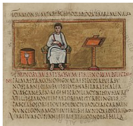
Vergilius romanus , manuscrit des œuvres de Virgile datant du v e siècle