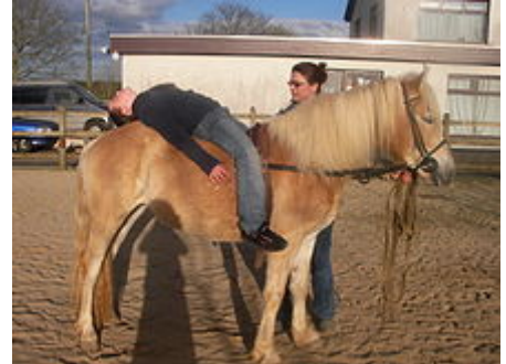
Relaxation en séance d'équithérapie.

L' équithérapie est une prise en charge thérapeutique , non conventionnelle et complémentaire aux soins médicaux. Elle prend en considération le patient dans son entité physique et psychologique, et utilise le cheval comme médiateur et partenaire thérapeutique afin d'atteindre des objectifs fixés en fonction de la spécialité du thérapeute ainsi que des besoins du patient.