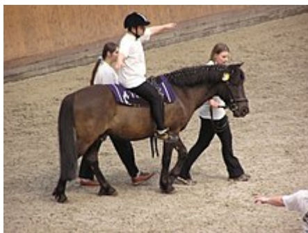
Séance d'équithérapie en république tchèque .

Les premiers essais d'utilisation du cheval en tant qu'outil thérapeutique sont marqués par l'histoire de Lis Hartel , cavalière danoise qui décrocha une médaille d'argent en dressage aux Jeux olympiques d'été de 1952 à Helsinki après avoir surmonté sa poliomyélite en poursuivant une pratique équestre intensive 10 . Cet exploit favorisa durablement le développement de pratiques équestres adaptées avec l'implication de personnels médicaux. C'est donc par l'aspect biomécanique du cheval que s'ouvre la longue voie qui mène jusqu'à l'équithérapie telle que nous la connaissons aujourd'hui 11 .