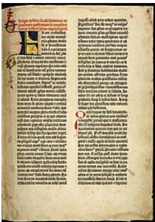
Une page de l'Ancien Testament tirée de la Bible de Gutenberg, composée à partir de la Vulgate de saint Jérôme (vers 1455).

Ce que les chrétiens appellent Ancien Testament provient d'un ensemble de textes religieux rédigés, pour leur très grande majorité, à l'origine en hébreu , et qui nous est parvenu sous la forme de copies 4 .