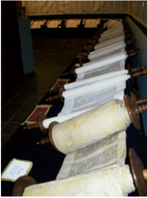
Ensemble des rouleaux du Tanakh.

Églises orthodoxes, qui les reconnaissent comme canoniques, ne les désignent par aucun terme particulier. Les Communautés ecclésiales protestantes ont un Ancien Testament calqué sur la Bible hébraïque et ne reprennent pas ces livres, qu'elles considèrent comme apocryphes .